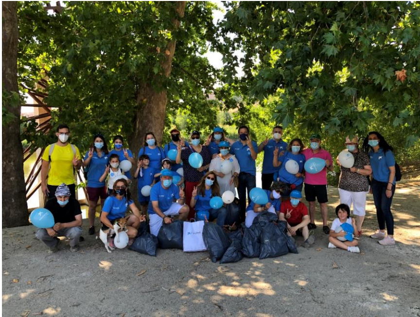
Participants de la batuda de recollida de residus a Toledo.

per a ella va ser un «esdeveniment ideal perquè fas activitats de cura i conservació del medi ambient i convius amb persones amb necessitats especials ». «És un gran aprenentatge per a un mateix i per als meus fills», explica De la Llave. «És fonamental que es comprometin amb l'entorn i que a més siguin conscients que hi ha altres realitats diferents de les seves», aclareix.