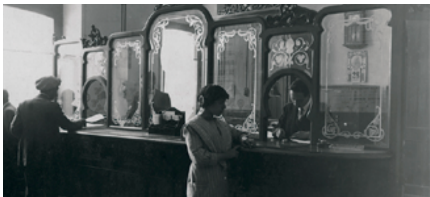
Empleats atenent el públic en una oficina de l'entitat a Vic

Aposta per la proximitat i la vinculació amb el territori, amb l'obertura d'oficines en els pobles principals de Catalunya.