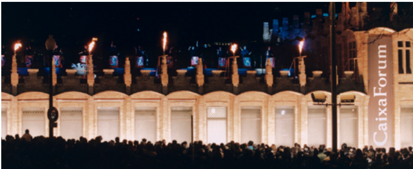
Inauguració de CaixaForum Barcelona

També s'inaugura a Barcelona CaixaForum, el nou centre cultural de la Fundació "la Caixa". Posteriorment, s'inauguraran altres centres similars a les ciutats espanyoles principals.