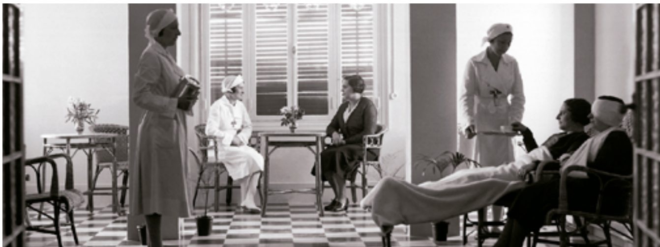
Sala de convalescència a la clínica de la Caixa de Pensions a Maó

S'estableixen com a àmbits prioritaris la salut, la igualtat i la cultura, iniciatives que s'aniran adaptant a les necessitats socials de cada època.