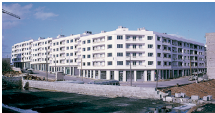
Promocions immobiliàries de caràcter social de "la Caixa" a Maó els anys 60

El Programa d'Habitatge de Caixa-Bank, en col·laboració amb la Fundació Bancària "la Caixa", és actualment un dels programes més rellevants del Grup "la Caixa": té un parc de més de 30.000 habitatges que s'ofereixen en lloguer per sota dels 500 euros.