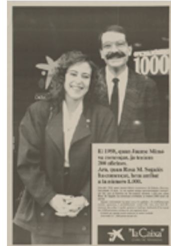
Anunci per commemorar les 1.000 oficines de l'entitat

Aquesta estructura territorial capil·lar –amb presència en el 100 % de les poblacions de més de 25.000 habitants– ha consolidat també un model d'incorporació dels avenços en innovació tecnològica, de manera anticipada a la resta d'entitats financeres. Prova d'això és la posada en marxa aquest any del primer TPV que permet pagar amb targeta als comerços.