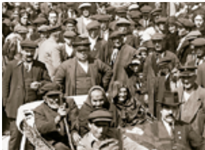
Homenatge a la Vellesa a Tàrraga el 1929

Se celebra com a mostra de consideració i suport a la gent gran, un compromís que perdura avui dia i que va suposar l'inici de l'Obra Social "la Caixa".