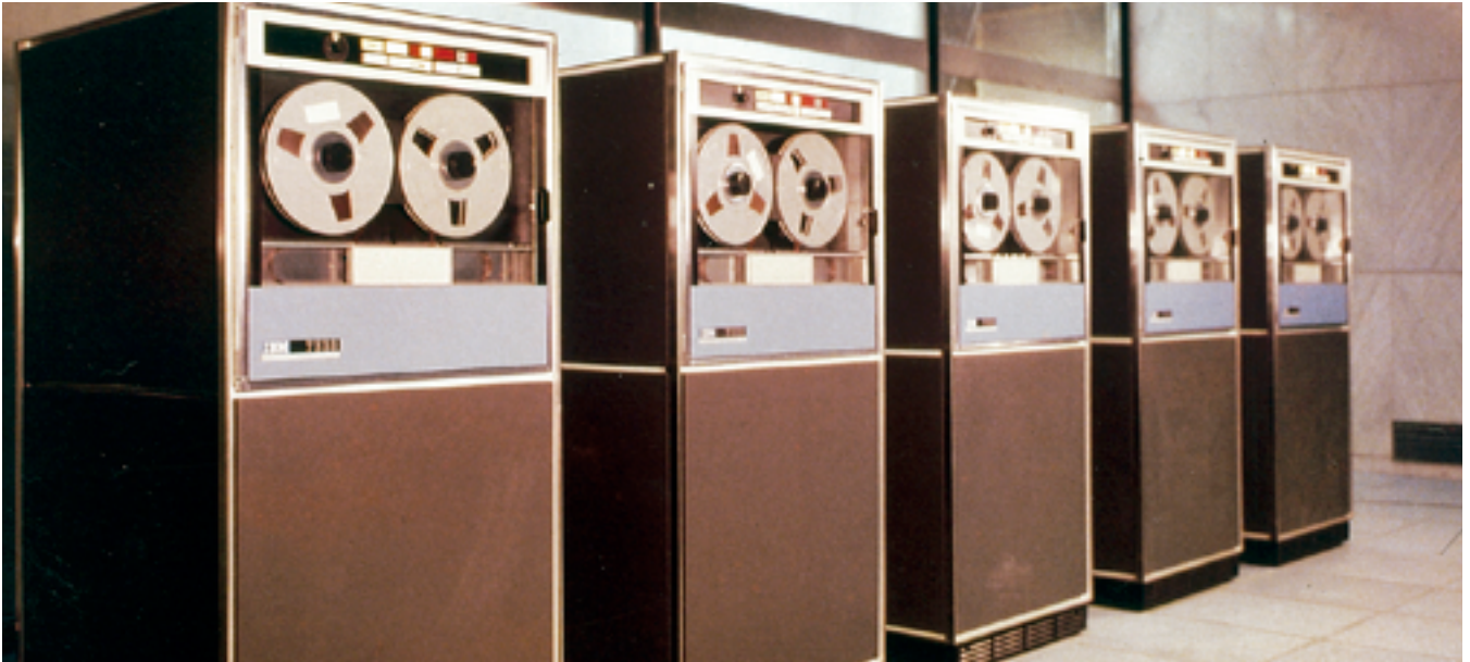
Primer ordinador IBM 1410

S'implanta el Servei Electrònic Comptable, fet que la situa davant dels competidors pel que fa a mecanització i teleprocés de dades.