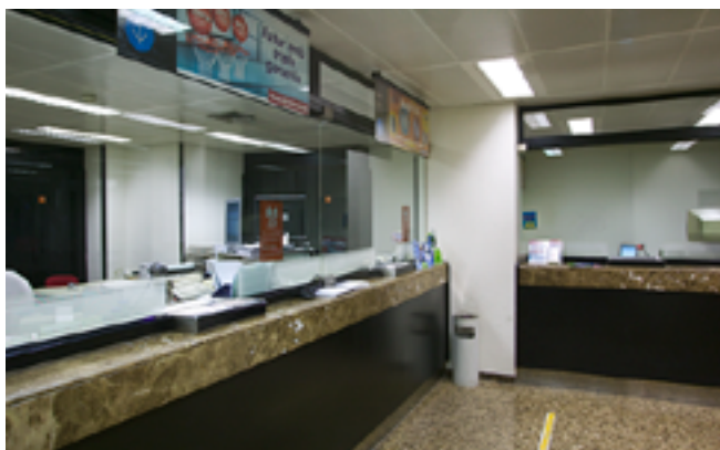
Oficina abans de la renovació

És pionera a prescindir dels taulells amb vidres a les oficines i a implantar el primer model d'oficina oberta d'atenció personalitzada. Per facilitar el diàleg s'eliminen les barreres físiques, que impedeixen la comunicació amb els clients i l'acció comercial.