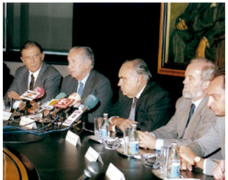
Constitució de la Caixa d'Estalvis i Pensions de Barcelona

Després de la fusió, "la Caixa" intensifica la seva política de servei i proximitat al client amb la contínua obertura d'oficines i una estratègia de millora de la productivitat i l'eficiència en la distribució, basada en la descentralització de la gestió i la inversió constant en tecnologia.