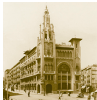
Primera seu social de la Caixa de Pensions, a la Via Laietana de Barcelona

L'edifici, dissenyat per Enric Sagnier i situat a la Via Laietana de Barcelona, va ser la seu emblemàtica de l'entitat durant molts anys.