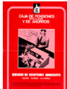
Publicitat de l'època que explica els beneficis del teleprocés

Amb el teleprocés, els clients poden resoldre les operacions quotidianes en qualsevol oficina, escollint la més propera en cada moment, cosa totalment inèdita a l'època.