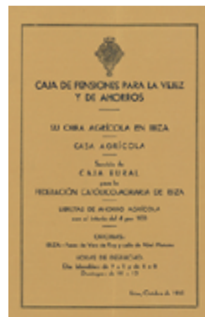
Conveniamb la Caixa Rural per a la Federació Catòlico-agrària d'Eivissa