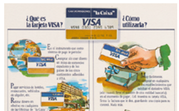
Cartell per explicar als usuaris com s'havien de fer servir les targetes

Posteriorment, el 1998 "la Caixa" serà la primera entitat europea a emetre totes les marques de targetes (Visa, MasterCard, Amex, Diners i JCB).