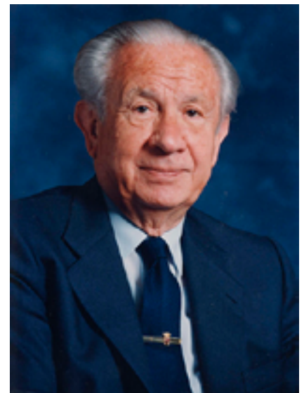
Joan Antoni Samaranch, president de la Caixa de Pensions