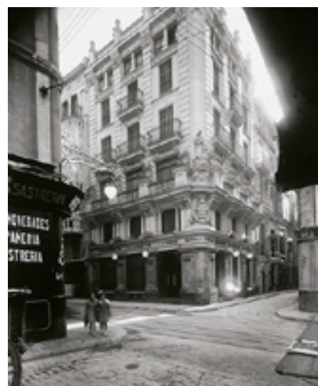
Primera oficina de la Caixa de Pensions a les illes Balears (Palma)